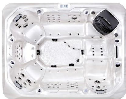
W04 - Perlweiss