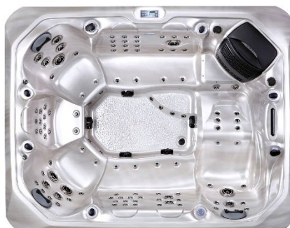
W21 – Silber marmoriert